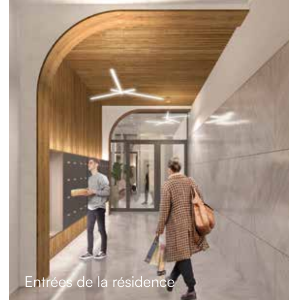
Entrées de la résidence

Enfin, chaque détail a été soigneusement pensé pour votre bien-être : des sols bois pour les pièces à vivre apportant chaleur et élégance, et des carrelages pour les pièces humides pour une praticité absolue.