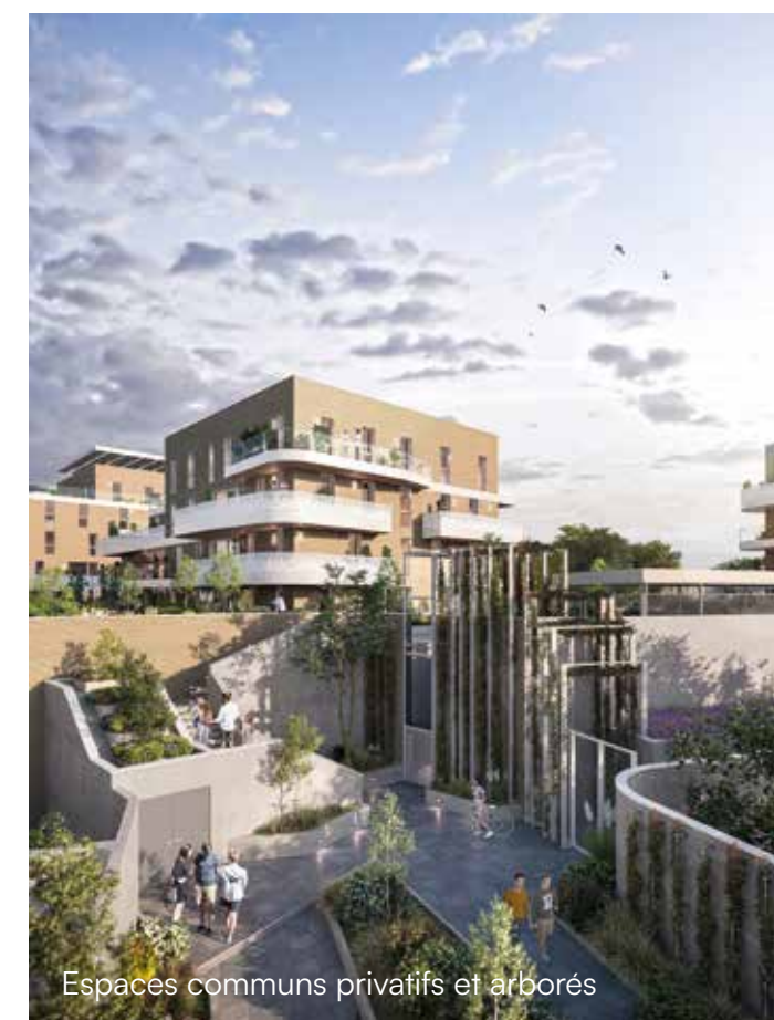
Espaces communs privatifs et arborés

2 min. à pied de la gare 2 min. à pied de la place Jean Bart 10 min. à vélo de la plage 1 arrêt de bus au pied de la résidence 160 places de parking dont \frac{1}{3} boxées